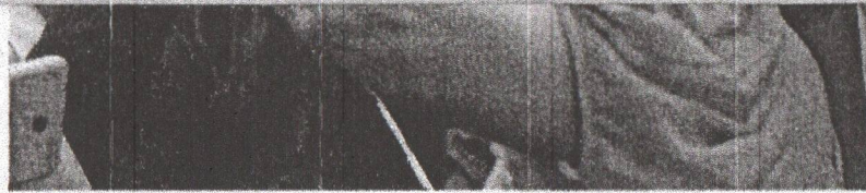
IZOLDA esteve ontem no III Fórum Estadual dos Grêmios Estudantis

"Na verdade, nós estamos trabalhando para isso (lançar o nome ao fim de junho). Não