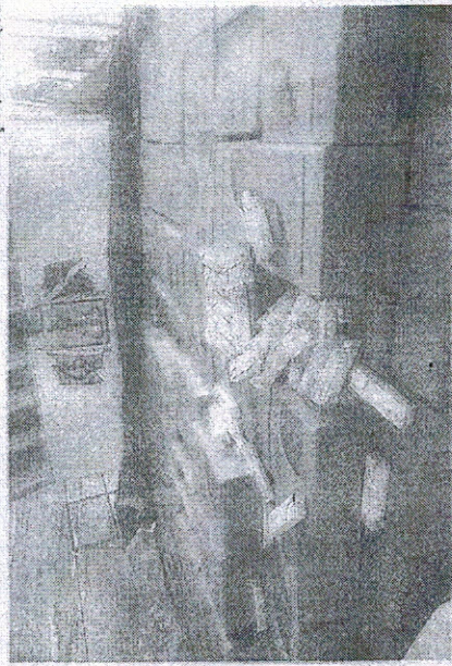
Cigarros contrabandeados apreendidos em Beberibe